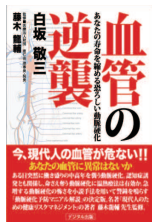
「血管の逆襲」 白坂 敬三著 定価：本体1,300円

今、現代人の血管が危ない！ あなたの血管に異常はないか？ 寿命を縮める恐ろしい動脈硬化