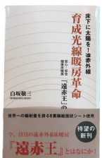
「育成光線暖房革命」 白坂 敬三著 定価：本体1,300円